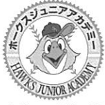
[ホークスジュニアアカデミー公式ロゴ]